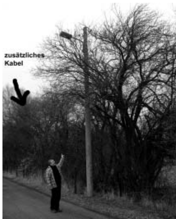
Herr Tschupke zeigt auf die zugewucherte Lichtleitung