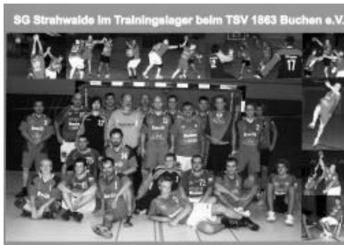
Gemeinsam nach dem Trainingsspiel

Sonntag, den 18.1.2009, 11.00 Uhr in der Sporthalle Niederoderwitz SG Strahwalde – SG Oberlichtenau